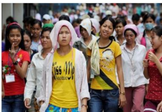
Factory workers returning home at the end of their shift in Phnom Penh, Cambodia

Работники фабрики возвращаются домой после окончания смены, Пномпень, Камбоджа