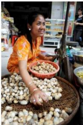
A working woman at a traditional market in Phnom Penh, Cambodia

48. Согласно прогнозам, Азиатско-Тихоокеанский регион сохранит свой статус наиболее экономически успешного и быстрорастущего региона 31 . Несмотря на то, что он показывает более высокие темпы экономического роста, чем любой другой регион мира, они значительно ниже, чем их средние значения до финансового кризиса 2008 года. В период 2012-2014 годов экономический рост в среднем составил 5,2 процента в год, в то время как за период 2005-2007 годов средний показатель достигал 9,4 процента. Прогнозы ЭСКАТО указывают на то, что темпы роста развивающихся стран этого региона в 2016 году составят 5 процентов, увеличившись по сравнению с показателем на уровне 4,5 процента, прогнозируемым на 2015 год 32 . По сути, в 2016 году практически во всех крупных странах, за исключением Китая, ожидается умеренное повышение темпов экономического роста. Предполагается, что в 2016 году постепенное замедление темпов экономического роста в Китае продолжится, что во многом обусловлено прилагаемыми в этой стране усилиями по переориентированию экономики на внутреннее потребление; согласно прогнозам, в 2016 году темпы роста снизятся до 6,5 процента с примерно 6,9 процента в 2015 году 33 .