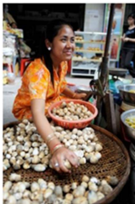
Femme travaillant dans un marché traditionnel à Phnom Penh (Cambodge)