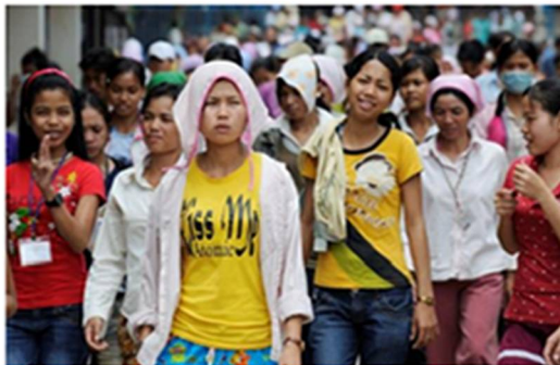
Ouvriers rentrant chez eux à la fin de leur quart à Phnom Penh (Cambodge)